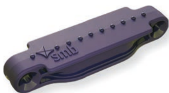
Perlbrombeer / Pearl blackberry