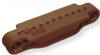
Mokkabraun / Mocha brown