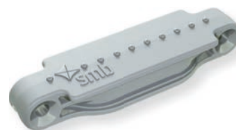
Alpakagrau / Alpaca grey