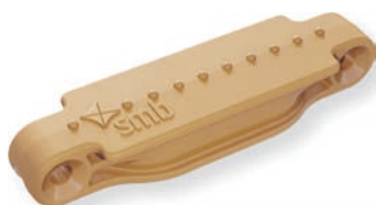
Sandbeige / Sand beige