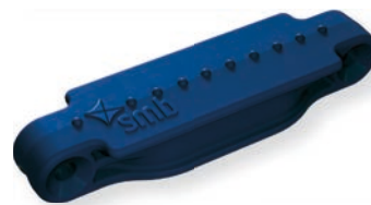
Lapisblau / Lapis blue