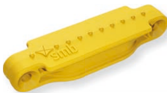
Baligelb / Bali yellow