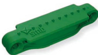
Borneogrün / Borneo green