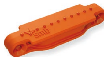
Jakartaorange / Jakarta orange