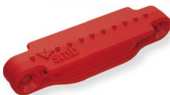
Bengalrot / Bengal red