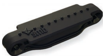
Persidionschwarz / Persidion black

Please note: The color depictions are non-binding. They may differ from the original for printing reasons.